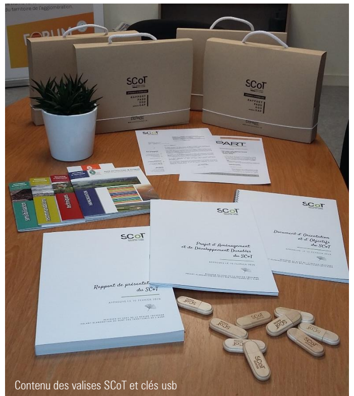
Contenu des valises SCoT et clés usb

Cette étape clé passée, le syndicat enclenche désormais la mise en œuvre du SCoT pour cette année 2021.