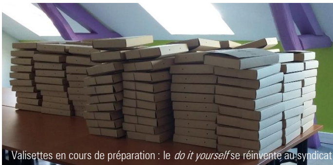
Valisettes en cours de préparation : le do it yourself se réinvente au syndicat

De quoi en faire des montagnes (de SCoT) !